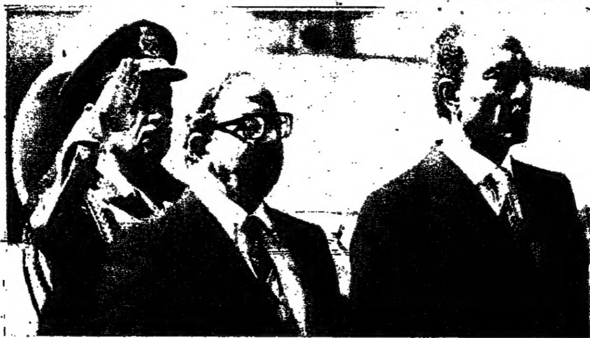
الرئيس السادات يستقبل رئيس الدولة السيد اسحق ناسون في مطار القاهرة الدولي ، يوم الاحد ٢٦-١٠-١٩٨٠